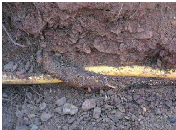
Deformace plastového potrubí kořenem stromu