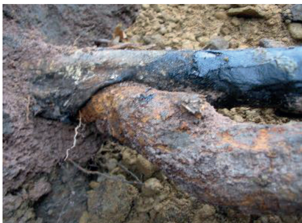
Poškození izolace potrubí kořenem stromu

Přítomnost vzrostlých dřevin v OP může být příčinou poškození plynovodů. Bezpečnostní riziko představují zejména kořeny stromů. Ty mohou poškodit izolaci podzemních potrubí, což může vést ke korozi a haváriím. Vzrostlé stromy mohou také blokovat přístup plynářům a složkám integrovaného záchranného systému k plynovodům při řešení havárií.